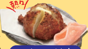
じゃがバターすり身天 398円 十税