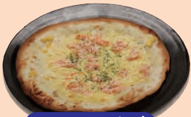
かにマヨピザ 698円 十税