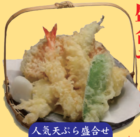
人気天ぷら盛合せ 698円 十税