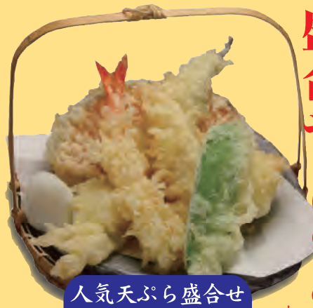
人気天ぷら盛合せ 698円+税