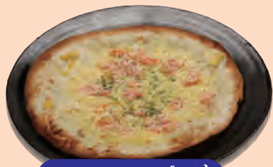
かにマヨピザ 698円+税