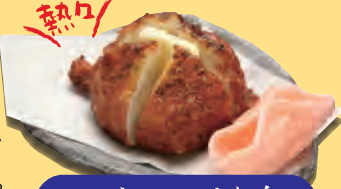
じゃがバターすり身天 398円+税