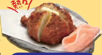
じゃがバターすり身天