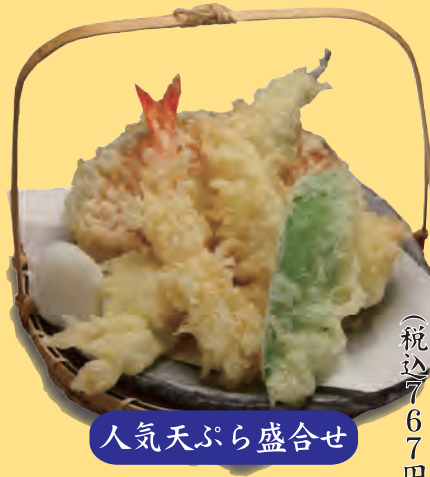
人気天ぷら盛合せ